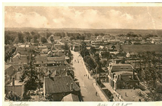
Rechts onder het grote huis van Gastelaars, de Wijngaardenlaan loopt voor het huis door tot de Schoolstraat. Iets verderop met veel bomen de Plantage, te herkennen aan de lichte streep van de nokken. De eerste bebouwing is de Papelaan. Omstreeks 1925.

Pas in de derde kwart van de 19e eeuw verrees aan de westzijde geleidelijk meer bebouwing: een nieuwe school, een huis voor de onderwijzer. De komst van de stoomtram in