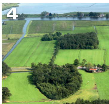
4 De Voorschotense landschappen in de tijd