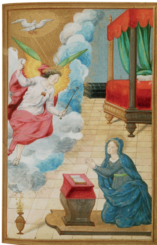
Annunciatie: Gabriel kondigt aan Maria de geboorte van Christus aan, Getijdenboek Catharina de Medici, + 1560, Den Haag, Koninklijke Bibliotheek, 74 G 39, fol. 39r.

Hoe weet een wetenschapper nu welke stijl aangehouden is in het stuk dat hij bestudeert? Vooral als de datum ligt tussen 25 december, Kerstmis, en 25 april, de laatste dag waarop Pasen kan vallen, kan dat verschil maken. Soms staat het er in het stuk zelf bij na de datum. Dan staat er bijv.: 'a navitate domini', na de geboorte van de Heer, van Christus. Dan is de kerststijl toegepast- het nieuwe jaar is op 25 december begonnen. Of er staat: nae gemeen scriven. Dat betekent dat de jaardagstijl is aangehouden- op 1 januari is het nieuwe jaar begonnen. Soms kan hij het afleiden uit wat gebruikelijk was bij