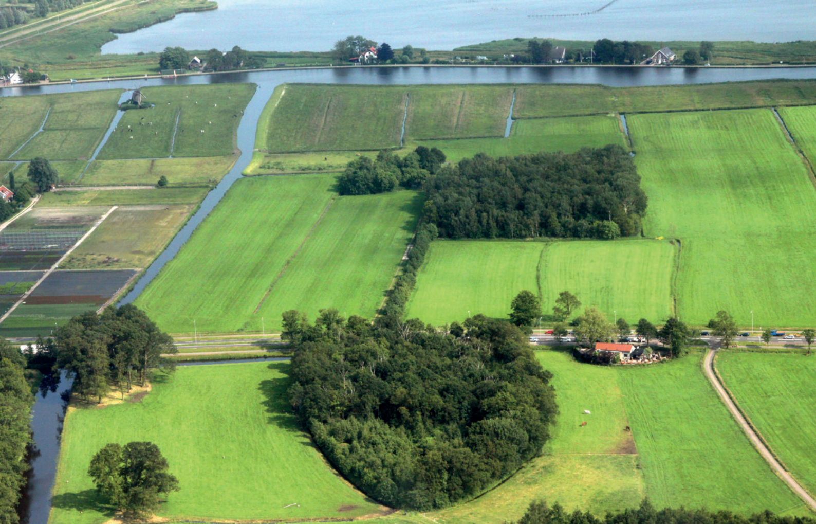
Het landschap met de middeleeuwse kavelpatronen bij het Eiland van Ome Nick.

wilde dieren. Hierin stonden vooral eikenbomen en enkele linden. Tussen de duintjes lagen grazige strandvlaktes met struwelen van wilgen en berken.