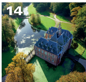
14 Duivenvoorde: levende geschiedenis