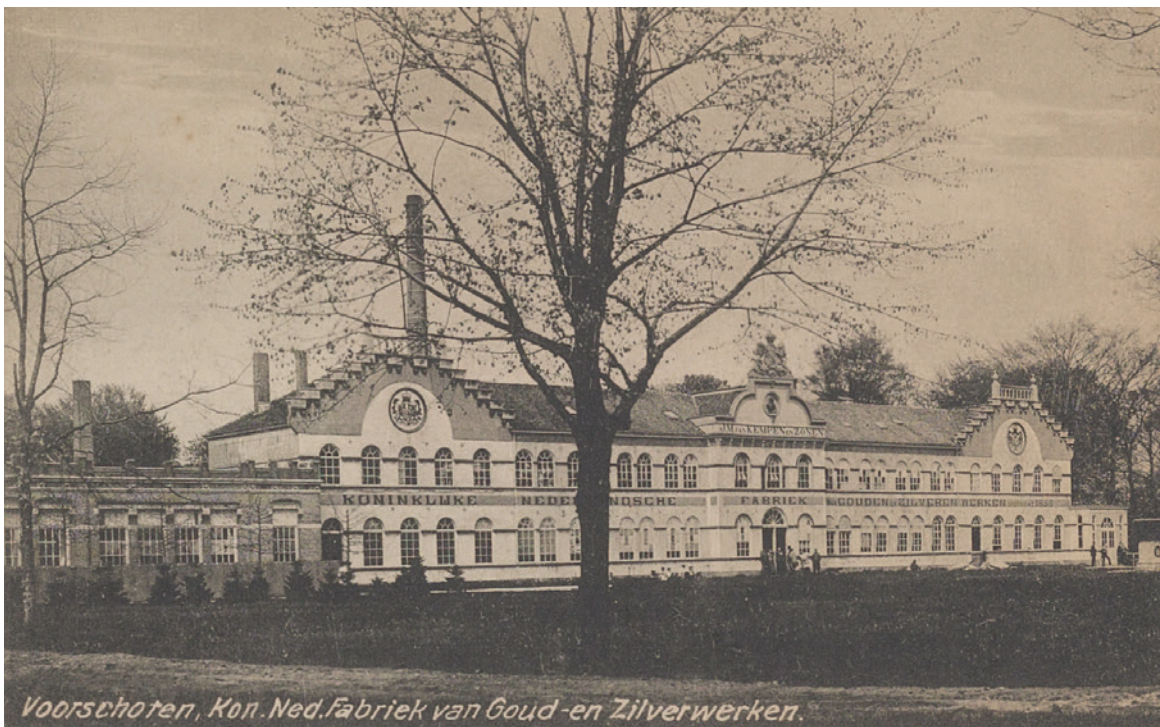
Foto van de fabriek van J.M. Kempen & Zonen te Voorschoten, ongedateerd (begin 20e eeuw)