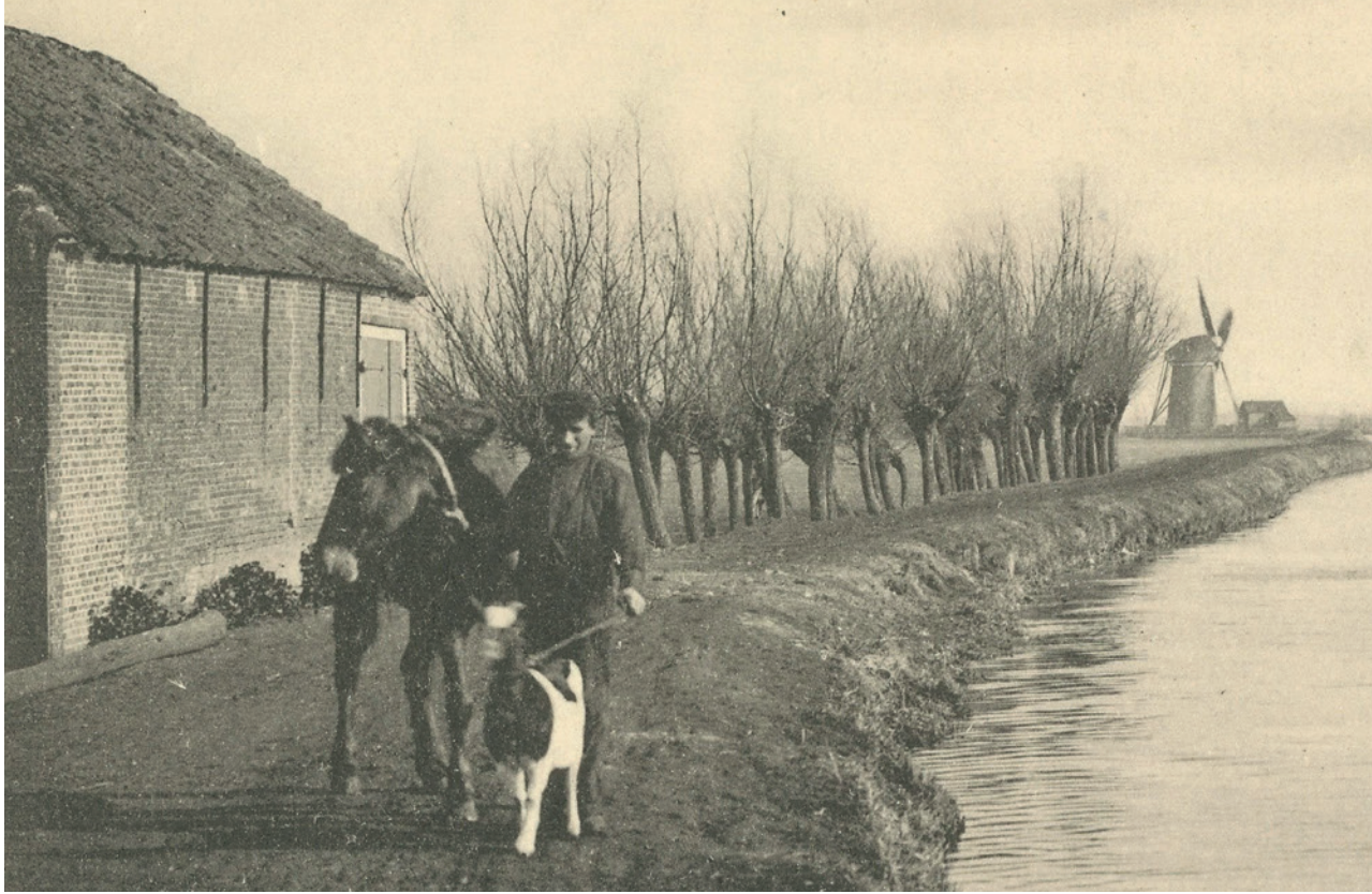
Molenaar en Kerksloot in 1900. Op de achtergrond langs de Vliet molen de Oranjeboom.

De werkelijk grote verandering werd veroorzaakt door de grote veenontginningen. Die begon bij de strandvlaktes aan de kant van Wassenaar waar door een nieuw slotensysteem de ontwatering werd verbeterd. De kavelvormen waren hier nog vrij onregelmatig omdat ook allerlei oude structuren werden ingepast. Maar vanaf ongeveer 1200 was de overzijde van de Vliet aan de beurt. Voorschoten kreeg hier uitzicht over een totaal nieuw landschap als het grote veenkussen wordt omgezet in akkers. De boerderijen kwamen in lange linten langs veenstroompjes en gegraven vaarten. Wuivend graan bepaalde het beeld.