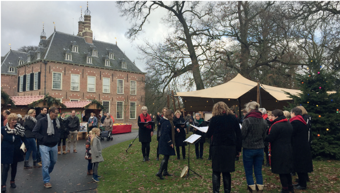
Kerst op Duivenvoorde, 2016.

we graag doortrekken naar onze verhuur. Mensen zijn hier toch een beetje op bezoek.