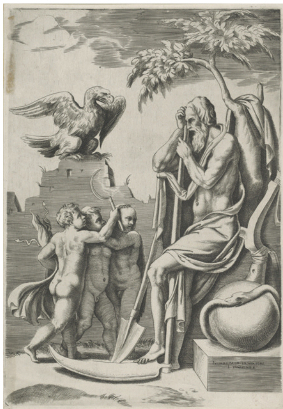
Allegorie op de tijd door Giulio Bonasone naar Giulio Romano, 1501-1580, Rijksmuseum Amsterdam.

dagen van het kerkelijke jaar: Maria Boodschap en Pasen. Maria Boodschap, op 25 maart, is de dag waarop herdacht wordt dat Maria van de aartsengel Gabriël de aankondiging kreeg dat zij uitverkoren was om de zoon van God ter wereld te brengen: 25 maart is negen maanden voor 25 december, de dag waarop de geboorte van Christus gevierd werd en wordt. Als het nieuwe jaar met Pasen begon, kon dat zijn op Goede Vrijdag om 12 uur na de mis of op Paaszaterdag. Pas aan het eind van de 16e eeuw begon het nieuwe jaar bijna overal weer op 1 januari.