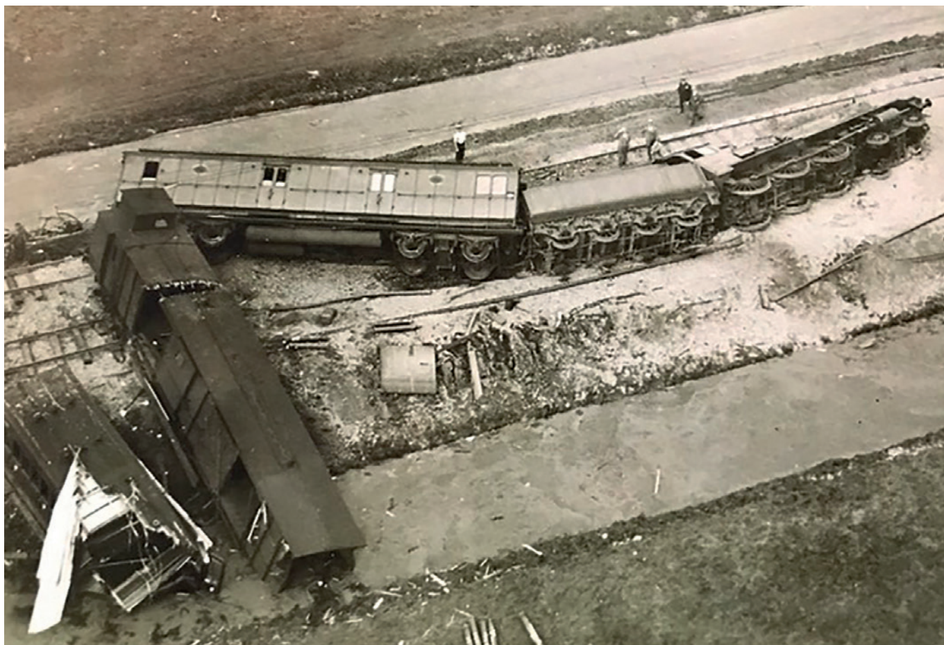
Luchtfoto gemaakt de dag na het ongeval. De bagagewagen is al doorgezaagd.

De locomotief, tender en postwagen lagen nog op hun kant. De bagagewagen was doormidden gezaagd. De eerste passagierswagen was