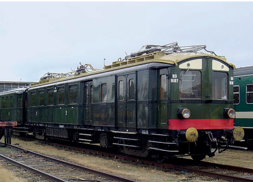
Materieel '24, bijgenaamd blokkendoos of stofzuiger.

op. Ik had ook wel eens gehoord, dat men dat doen moest in geval van gevaar, deed het en juist brak de compartiment open en werden we naar beneden geslingerd in het water.'