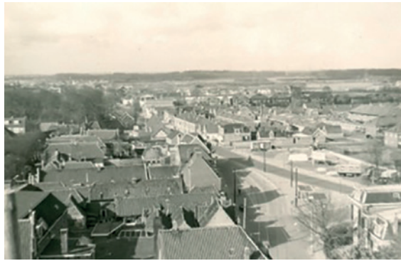
Rechts onder nog een stukje van de villa Gastelaars, rechts daarvan de nieuwe Koningin Julianalaan en links ervan de dubbele trambaan. Genomen voor 1957, de winkelgalerij is nog niet gebouwd