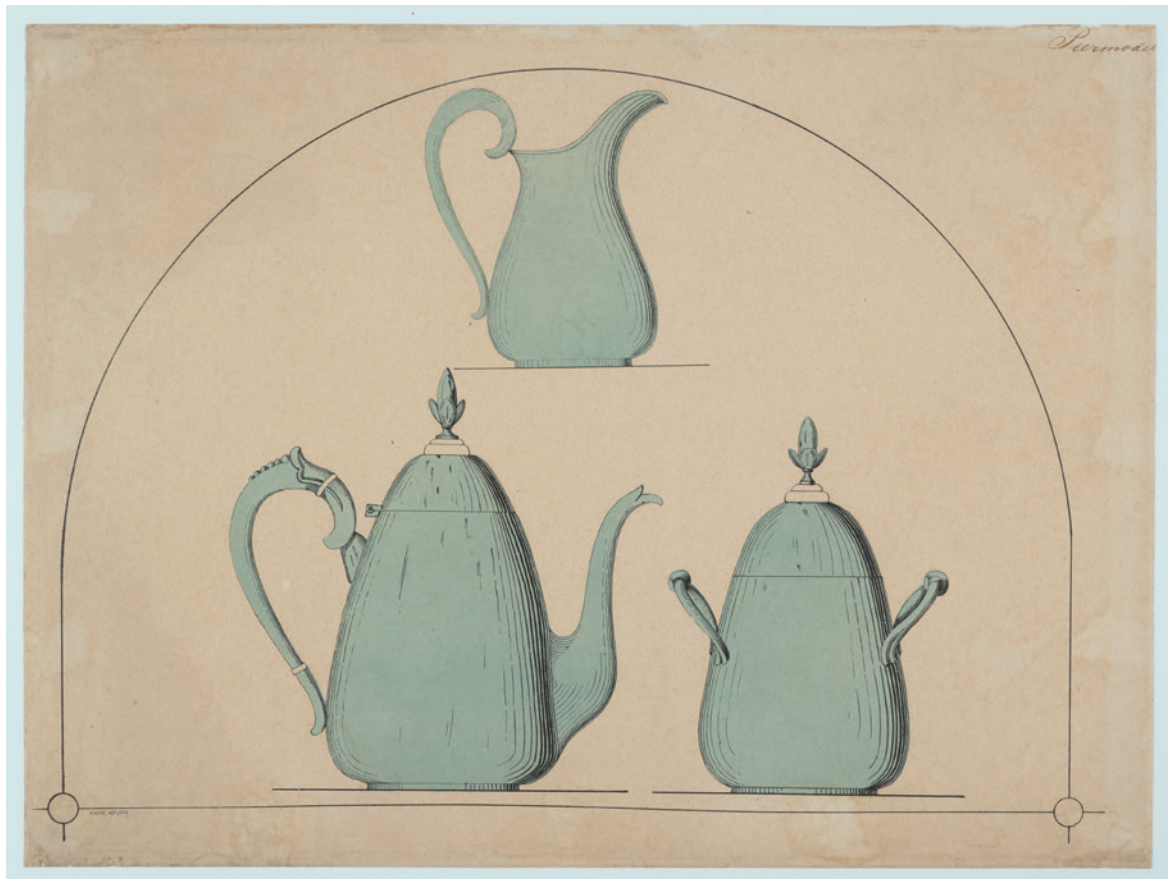
J.M. van Kempen & Zonen, presentatietekening thee- en koffieservies, model Peer, 1870-1919, RKD, Archief Van Kempen & Begeer, inv.nr. 3032.